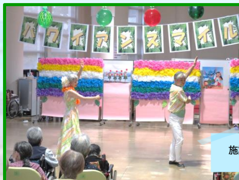
施設長夫妻による フラダンス