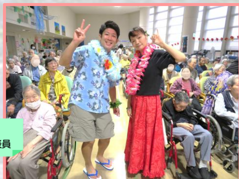
今年の司会 はリハビリ職員と相談員

ハワイアンメニューのお食事、デザート 大学生ボランティアさんによるフラダンス 職員のフラッシュモブ 夏の締めくくり、にぎやかで暑い一日を過ごしました。